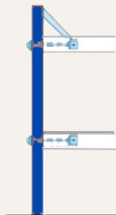
圖3：典型的抗震改建工作包括將地板與牆壁連接以及加固女兒牆。