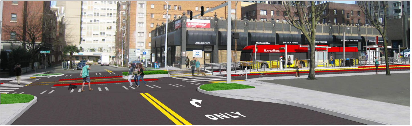
Đường Madison St và đường Terry Ave