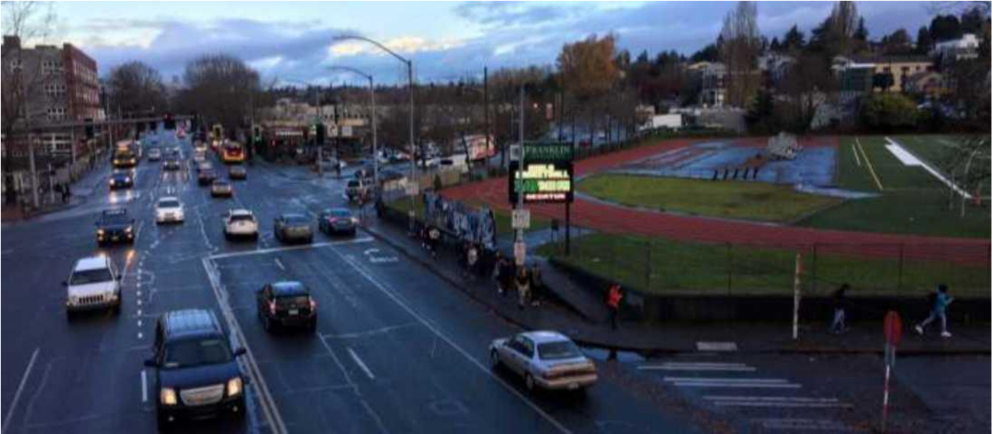
Rainier Ave S እና Martin Luther King Jr Way S መስቀለኛ መንገድ በዋና ዋና መዳረሻዎች መካከል ይገኛል፤ ለምሳሌም የ Mt Baker Link ቀላል ባቡር ጣቢያ፣ የኪንግ ካውንቲ ሜትሮ ትራንዚት ማዕከል፣ Franklin 2ኛ ደረጃ ት/ቤት፣ ቤቶችና የቸርቻሮ ንግድ ቦታዎች ይገኙበታል።

የአጭር ጊዜ የእግረኛ መንገድ/የብስክሌት መንገድ ማሻሻያ ስራዎች