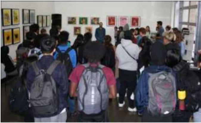
Mt Baker Hub የአውትሪች ዝግጅት ከ Franklin 2ኛ ደረጃ ት/ቤት ተማሪዎች ጋር