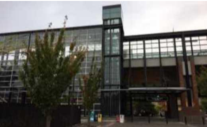
Mt Baker የቀላል ባቡር ጣቢያ