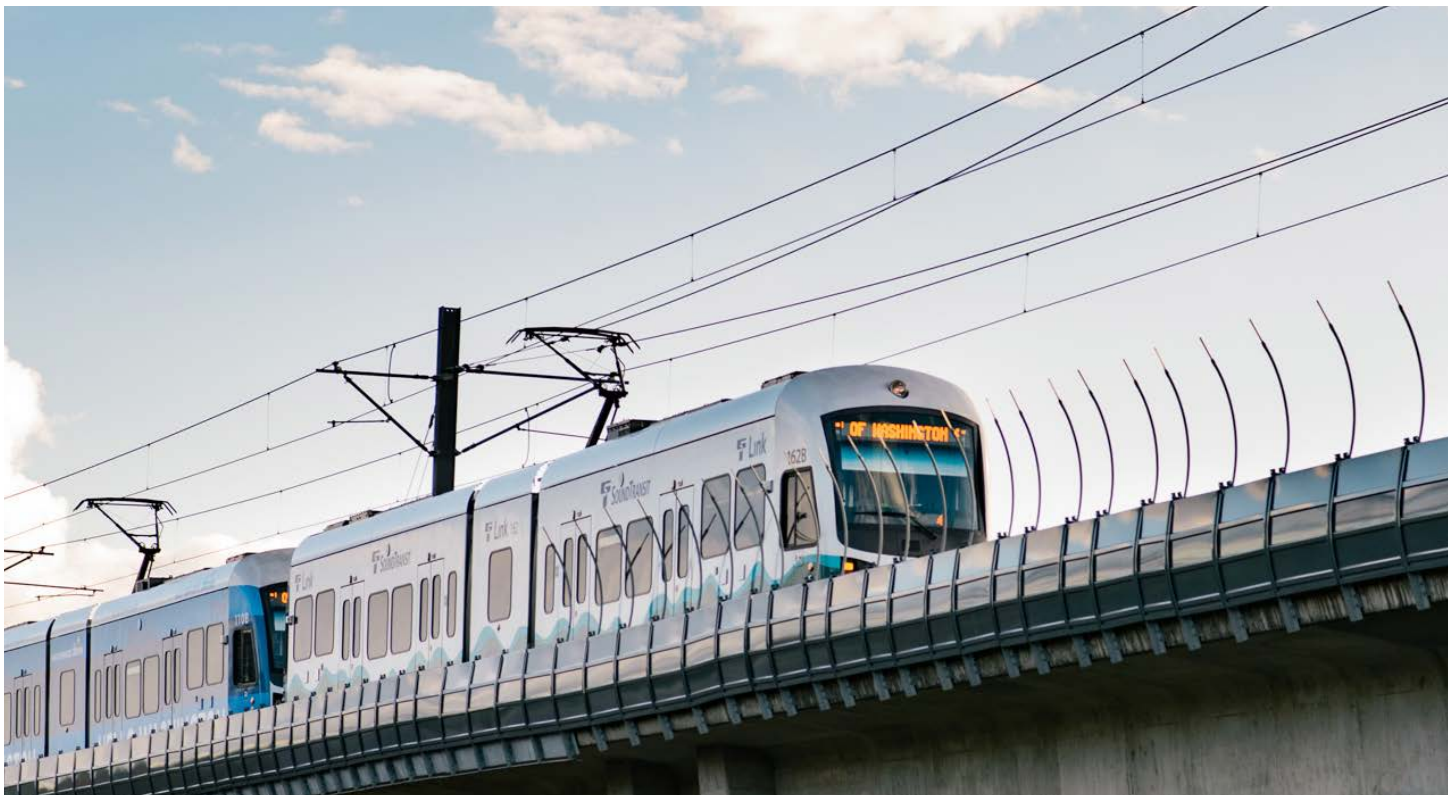
El tren ligero llegará pronto a la NE 130th y la I-5

*Los periodos de construcción pueden cambiar. Depende de cuándo estén listos los trabajadores y los materiales.