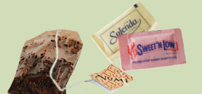
Subba shayyi kan waraqaa fi mi'oofsituu