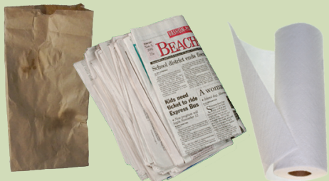
Subba waraqaa Fi fookaa waraqaa fud-soyildi