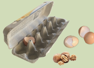
Qola buuphaa (hanqaaquu), qolaocholonii (Sanduqaa waraqaa fud-soyildi)