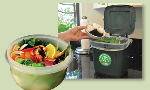
Qabiyyee salphaa irra debi'aani fayadaamu danda'aan

Subbin kaneen plaastiki fakkatan garuu biqiltoota irra waan tolchaamanif xaa'oo dikeeti jijjiramu ni danda'uu.