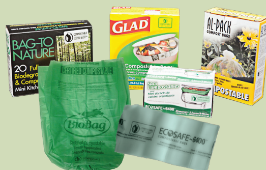
Subba Xaa'oo dikee raggaasisaame

Subbin kaneen plaastiki fakkatan garuu biqiltoota irra waan tolchaamanif xaa'oo dikeeti jijjiramu ni danda'uu.