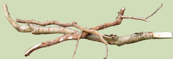
Harcummee fi birkii (4 feet dheera fi 4 inches furdaa gaddi ta'ee)