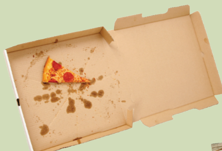
Qodaawwan piizzaa xuraawoo