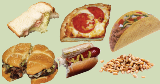
Daabboo fi lja midhaanii