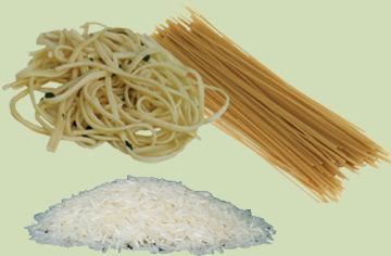
Paastaa fi ruuzii