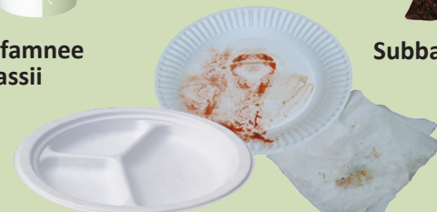
Sahaanii waraqaa hin uwwifamnee fi napkini