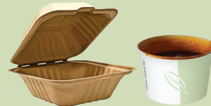
Waraqaa hin uwwifamnee qabiyyee ala bassii