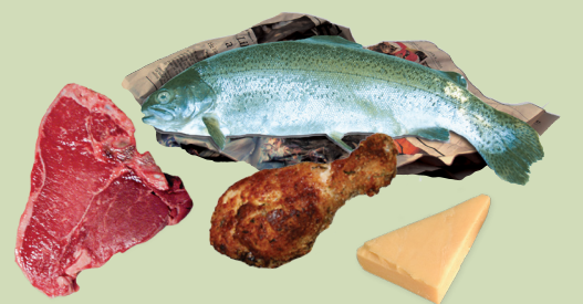
Foon, qurxummii fi bu'aalee loonii