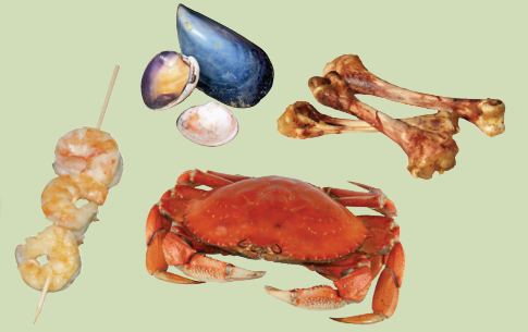
Qola, lafee, fanniftuu fooni mukaa