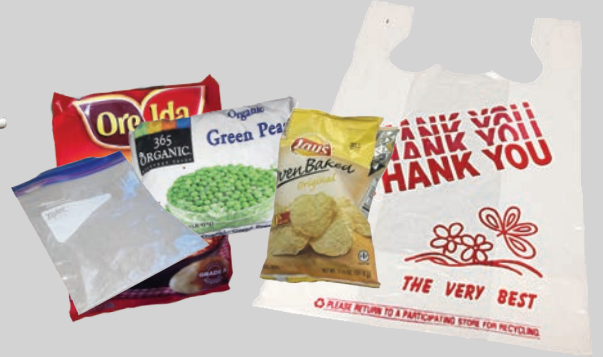
Ziploc®፣ የምግብና ብቸኛ የፕላስቲክ ክረጢቶች