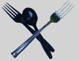
የሚብሰዩ ቤት ዕቃዎች