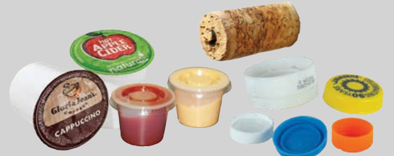
አስተኛ ኪዶች፣ ክዳኖችና ኑባያ (ሰፋቱ ክፍሎች በታች የሆኑ)