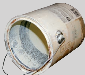
የቀከም ቆርቆሮዎች (ኪድ የኬካው፣ ደረቅና ባዶ)