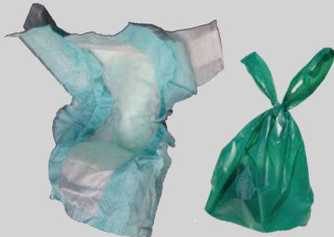
ዳይፐሮችና የቤት አንሰሳት አዳሬ (በክረጢት የታሸገ)