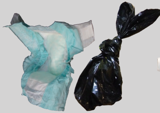
अँगोछी तथा पेट का कचरा (लनया ग या)