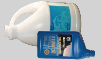
खाली व वप धातु को रखने के सलए पात्र