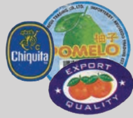
फलों के स्टिकर्स