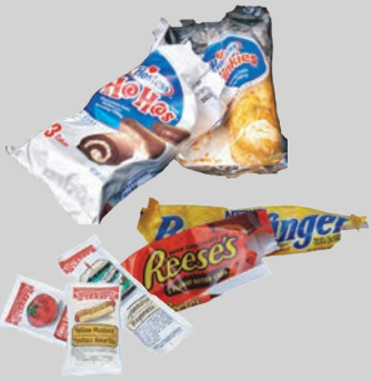
भोजन के सलए आवरण