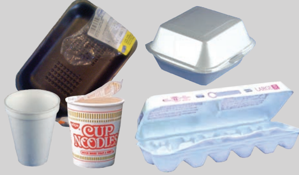
फोम कंटेन र्स