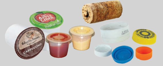
चोटी पलक, टोपी तथा कप (तीन इंच चौड़ा इ से कम)