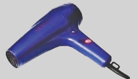
गृह की छोटी व तुएँ