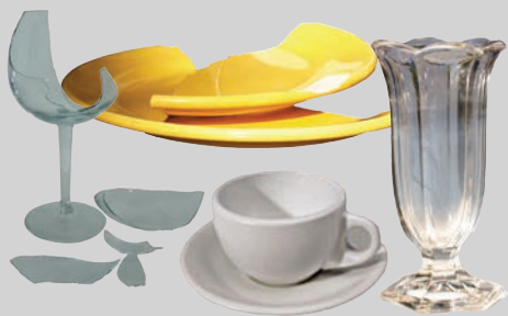
सम्ही तथा शीशे से बने पात्र (टूटे हुए या प्रयोग न होने वाले)