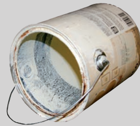
रंग के ड डबवे (ढक्कन को लगाना, सूखा तथा ाखाली)