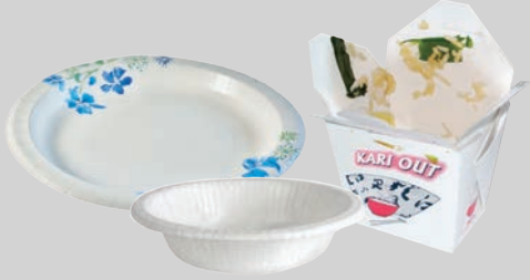
फूड सोइल डले व पत्र (चमकीला) कोगज की प लेट, कटोर रयों और नकालने वाले पात्र