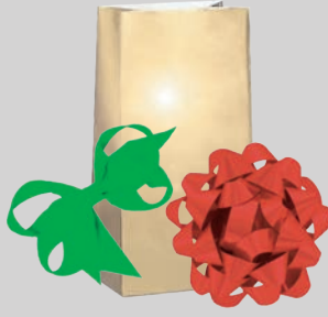
फीता, कमान तथा धातु से बना उपहार का आवरण