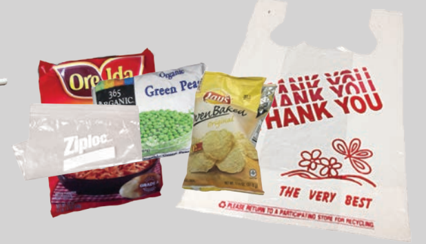
Ziploc®, खाघ तथा एकल प लास्टक थैले