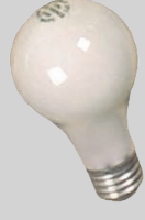
नॉन फ लोरसेंट बल ब