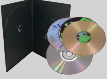
CDs (सीड डियों), DVDs (डीवीडी) तथा बक से

इन चीजों को आप अपने कचरे की गाड़ी में डालें ।