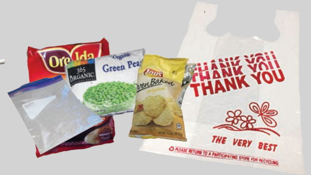
Ziploc®, 음식, 비닐봉지