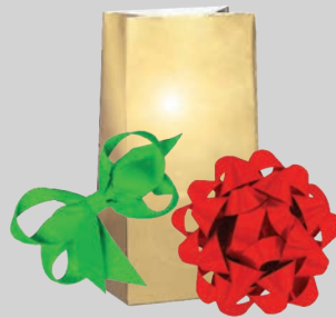
Cintas, lazos y papel de regalo metálico