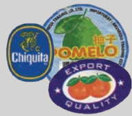
Calcomanías de frutas y verduras