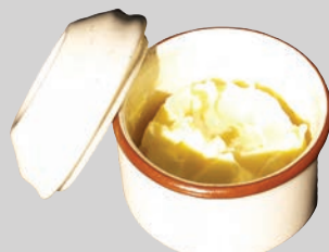
Manteca, aceite y grasa de la cocina (en un recipiente con tapa)