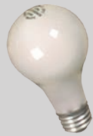
Bulbos o focos tradicionales (no de espiral o fluorescentes)