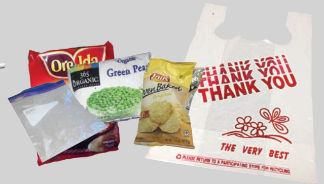
Bolsas sueltas, de alimentos o Ziploc®