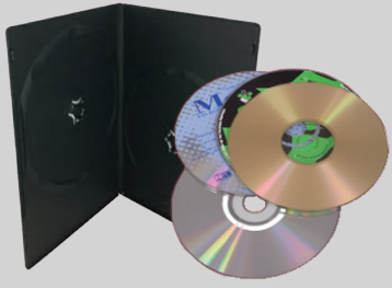
CDs, DVDs y sus estuches

Ponga estos artículos en su contenedor para basura.