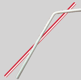
Pajillas o popotes