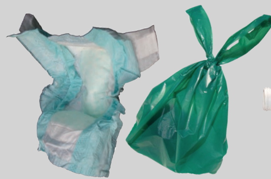
Pañales y desperdicios de mascotas (ponerlos en una bolsa)