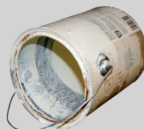
Latas de pintura (vacías, secas y sin tapa)