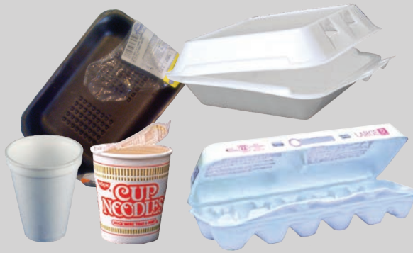
Recipientes de hule espuma o polietileno