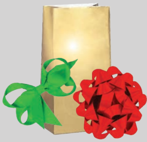
Dải ruy-băng, nơ, và giấy gói quà bằng kim loại