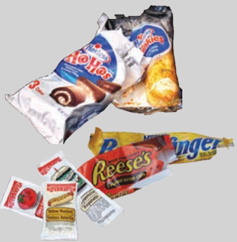
Giấy bọc thức ăn