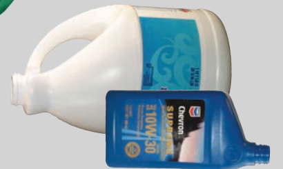
Đồ hộp đựng kim loại độc hại