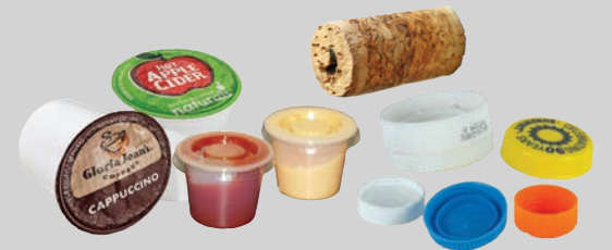
Nắp nhỏ, mũ, nắp chai & tách (rộng dưới 3 inch)