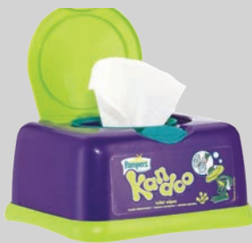
Sản phẩm vệ sinh