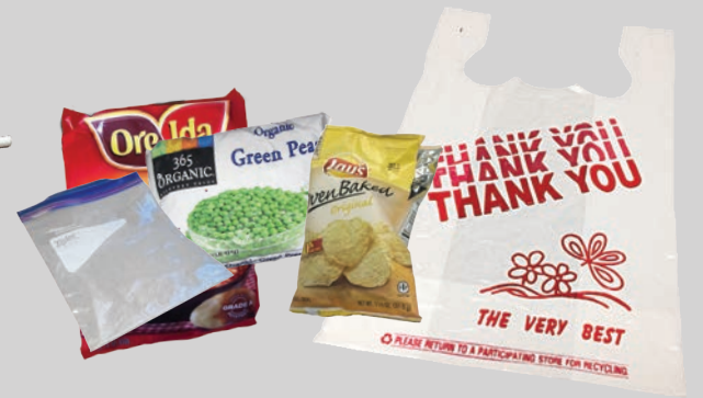
Túi khóa Ziploc®, túi đựng thức ăn & túi nhựa rời