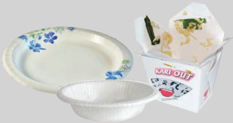
Đĩa, tô và hộp đựng đồ mua về bằng giấy ốp mặt (lớp trắng bóng) dính thức ăn