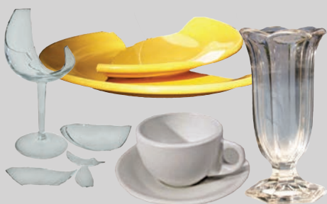
Đồ gốm & thủy tinh (bị vỡ hoặc không thể sử dụng)