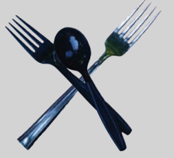
Dụng cụ dùng trong nhà bếp