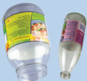
ຂວດ ແລະ ໄຫ