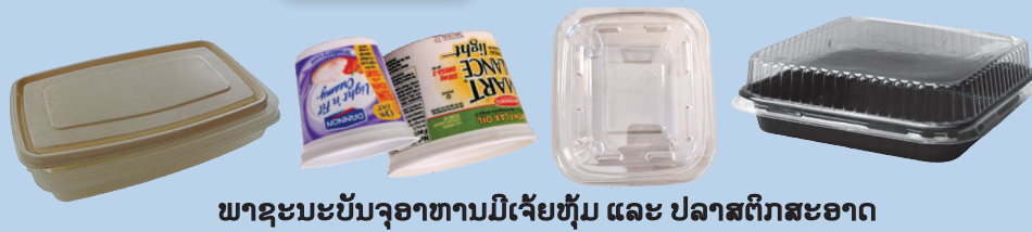
ພາຊະນະບັນຈຸອາຫານມີເຈ້ຍຫຸ້ມ ແລະ ປລາສຕິກສະອາດ