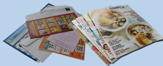
ເຈ້ຍຈິດໝາຍ, ວາລະສານ, ເຈ້ຍປະສົມ