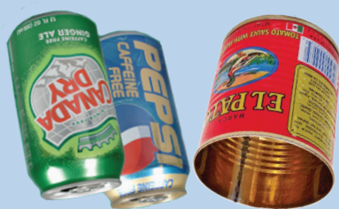
ກະປ້ອງອາລູມິນຽມ ແລະ ໂລຫະ