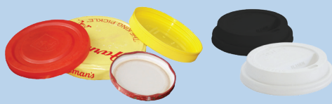
ຝາປິດ (3 ນິ້ວ ຫຼື ກ້ວາງກ່ວານັ້ນ)