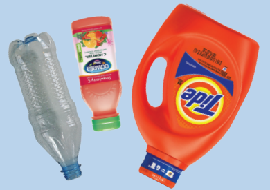
ຂວດປລາສຕິກ (ສີທັງໝົດ)