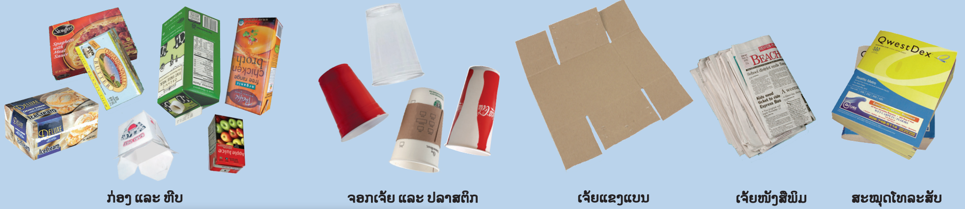
ກ່ອງ ແລະ ຫີບ