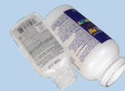
ຂວດເມັດຢາ (ທ້າມມີຫຼອດຢາຕາມລັງ)