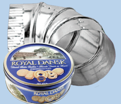
ໂລຫະເສດ (ໜ້ອຍກ່ວາ 2 ຟຸດ x 2 ຟຸດ x 2 ຟຸດ)