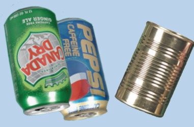
Lo nhôm & kim loại