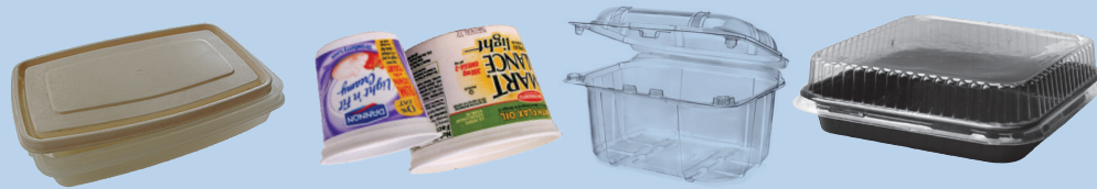
Hộp đựng thức ăn bằng nhựa sạch & giấy ốp mặt