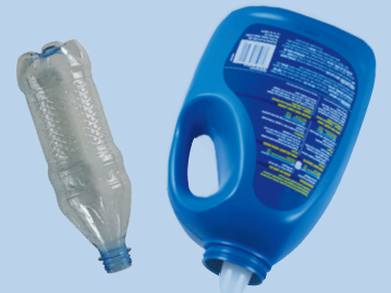
Bình nhựa (tất cả các màu)