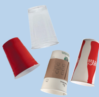
Tách giấy & nhựa