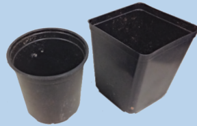
Chậu trồng cây bằng nhựa