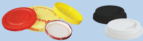
Nắp (rộng 3 inch trở lên)