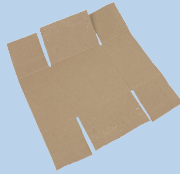
Thùng giấy đã làm bẹp