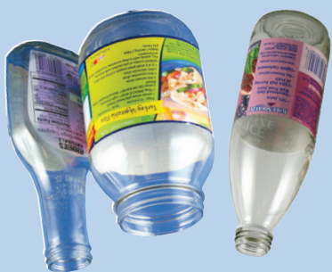
Bình & lọ