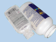
Lọ thuốc (không phải lọ thuốc nhỏ theo toa)