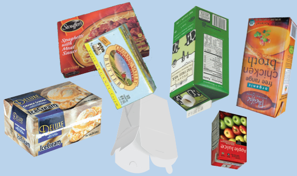
Hộp & hộp bìa cứng