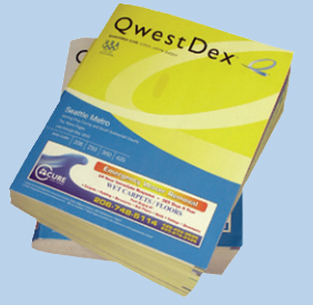
Sổ điện thoại