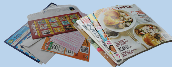
Thư từ, tạp chí, giấy hỗn hợp