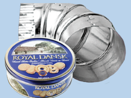
Kim loại vụn (dưới 2 ft. x 2 ft. x 2 ft.)